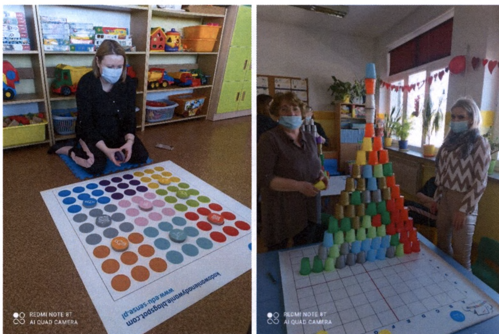
Zdjęcia własne: szkolenie nauczycieli

Dofinansowany ze środków Unii Europejskiej w ramach Europejskiego Funduszu Społecznego. Umowę na dofinansowanie projektu zrealizowano w 2021 roku. łączna kwota zadania to 184 032,40 zł, w tym dofinansowanie 164 982,46 zł.