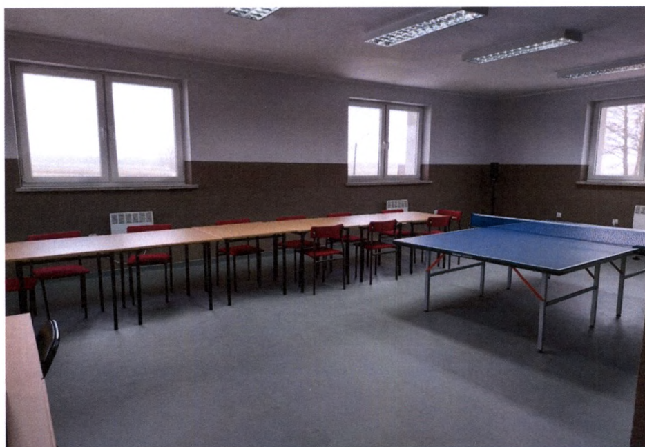
Zdjęcie własne: wyposażenie Wiejskiego Ośrodka Aktywności Lokalnej w Zubrzycy Wielkiej