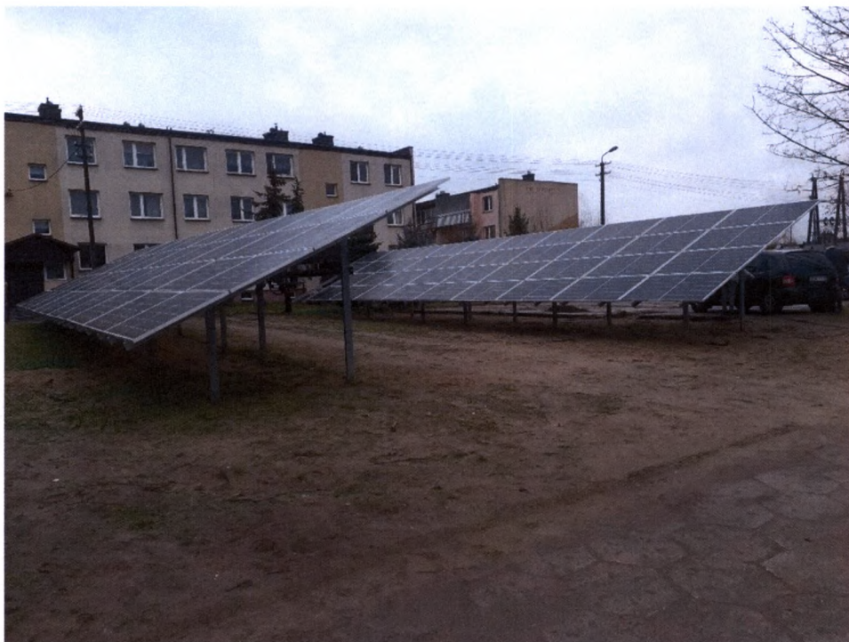
instalacja fotowoltaiczna przy hydroforni w Szudziałowie

Dofinansowany ze środków Unii Europejskiej w ramach Regionalny Program Operacyjny Województwa Podlaskiego na lata 2014-2020. Umowę na dofinansowanie projektu zrealizowano w 2021 roku. Łączna kwota zadania to 657 435,00 zł, w tym dofinansowanie 509 731,44 zł.