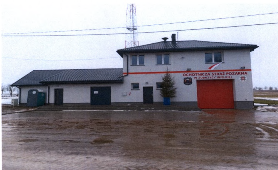
Zdjęcie własne: Wiejski Ośrodek Aktywności Lokalnej w Zubrzycy Wielkiej

Dofinansowany ze środków Unii Europejskiej w ramach Regionalnego Programu Operacyjnego Województwa Podlaskiego na lata 2014-2020. Łączna kwota zadania to 413 423,13 zł, w tym dofinansowanie 299 980,92 zł.