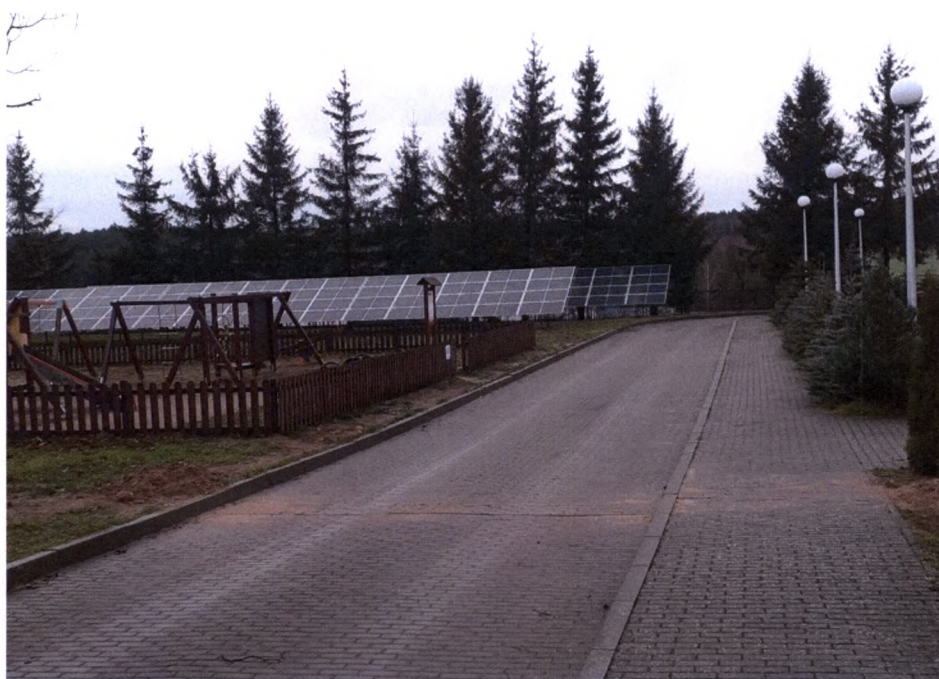
instalacja fotowoltaiczna przy Szkole Podstawowej w Szudziałowie